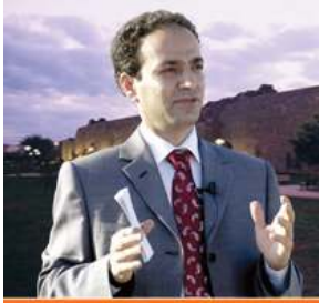
Diyarbakir Büyükşehir Belediye Başkanı Av. Osman Baydemir'in GÜNEŞEVİ Açılış Konuşması Tam Metni